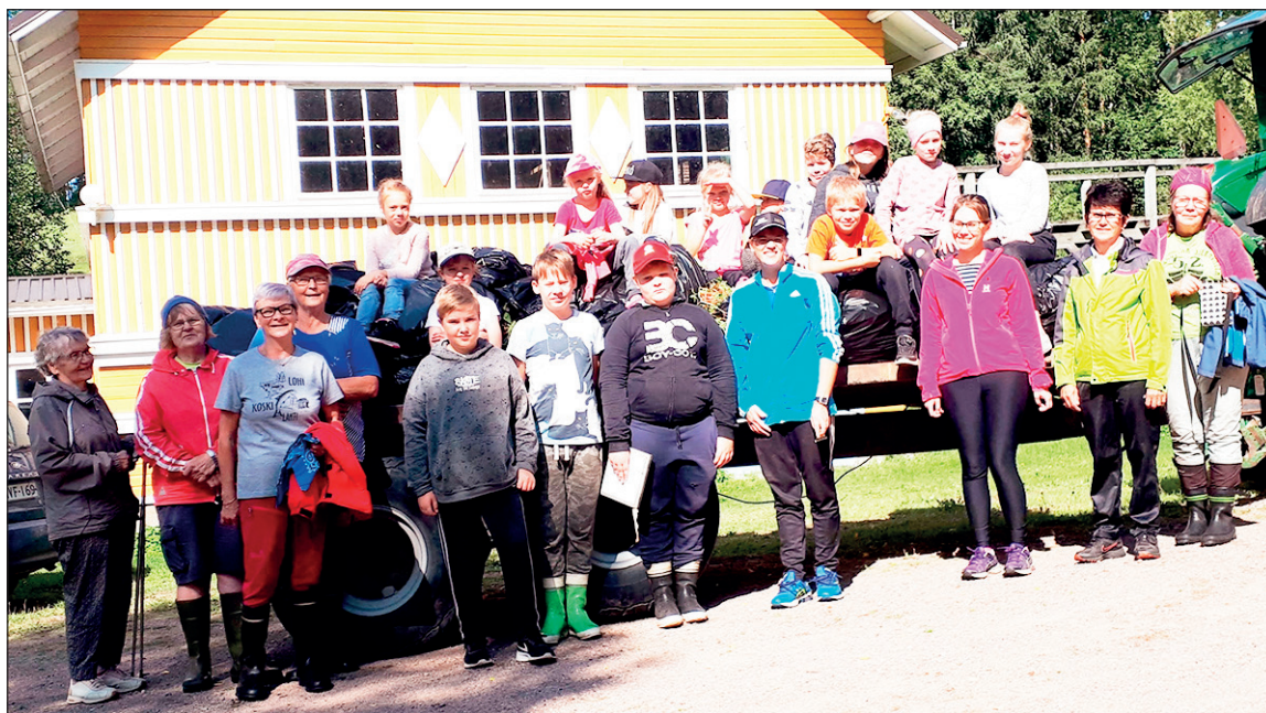
Palkitut talkoolaiset. Jättipalsamia kitkettiin noin 40 jätesäkkillistä. Ne poltettiin Lohilahden kossessa. Näin siemenet eivät enää pääse leviämään.

Lähistöllä on myös valtakunnallisesti arvokas perinnebiotooppi