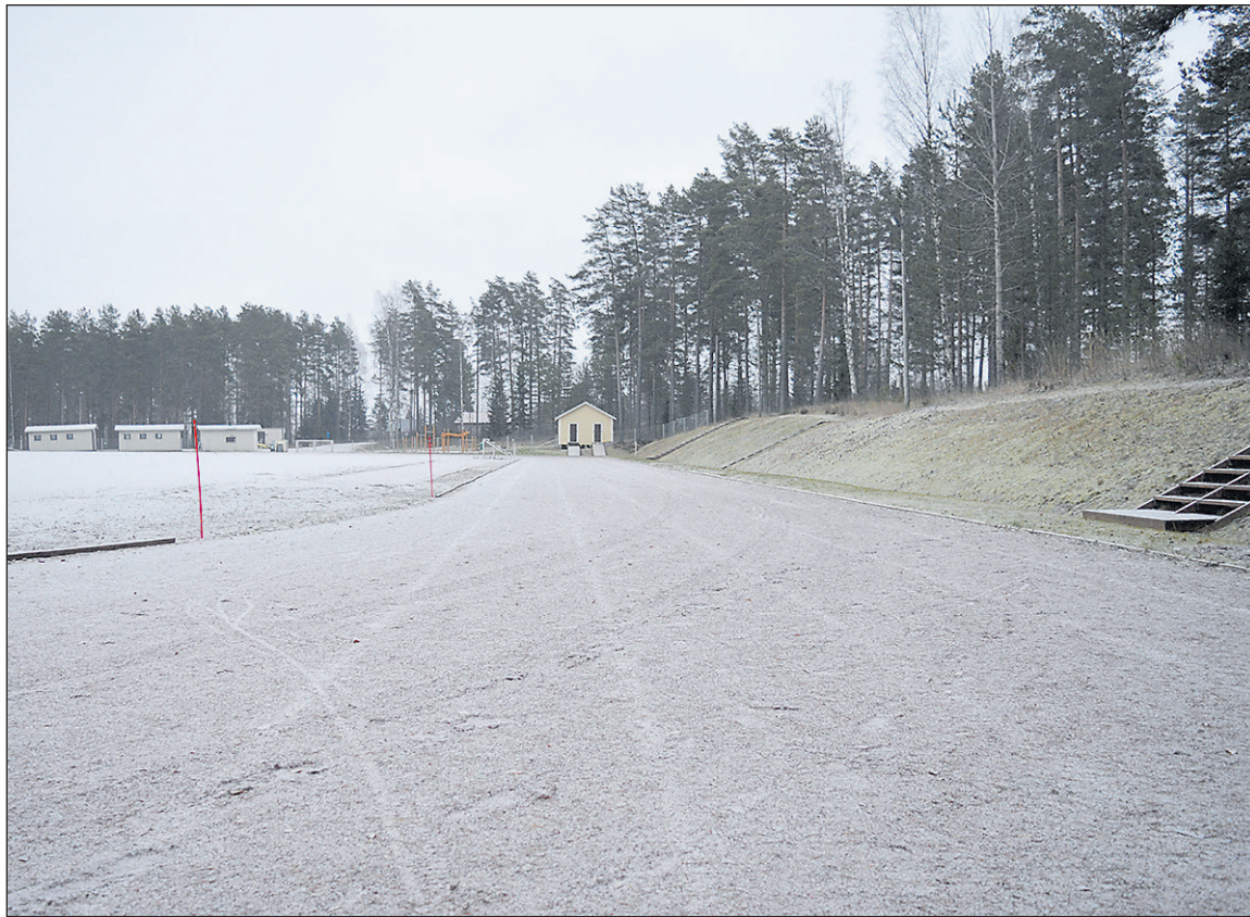
Urheilukentällä ei vielä pääse hiihtämään, mutta kesälajeille suorituspaiikat ovat vanhanaikaiset, ja tekniset laitteet sekä pukuhuone, vessa, toimistotilat ja välinevarastot puuttuvat tai ovat käyttökelvottomia kuntalaisaloitteen mukaan.

– Toki niidenkin käytettävyyttä voisi parantaa. Heittopaikoilla ei ole