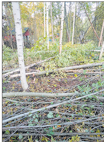
Tontti ennen kuin puiden järjestämistä.

Aloitin puiden kasaamisen 5.11.2019 ja olen tehnyt tähän