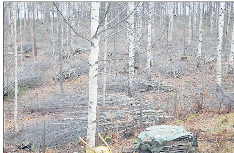
Tontti kirjoittajan urakoinnin jälkeen.

Olen todennut, että jopa sormeni lihakset ovat vahvistuneet työnteosta,